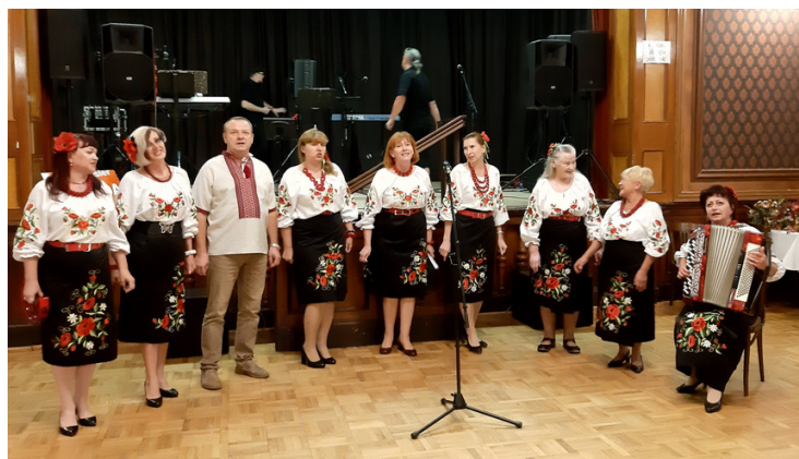
Koncert ukrajinského folklorního souboru Radist'.